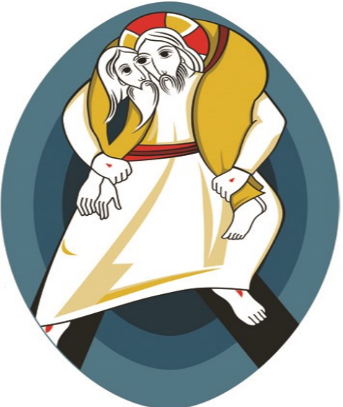
ኣ ኣዳም ፍርዲ ሞት

ኣዳምን ሂዋንን ንሕልምን ባህግን እግዚአብሔር ኣይፈጸሙን። ቃል ኣምላኽም ኣይሓሎዉን። ኣብ ናይ ቆጶራ ቦታኣም ኣይተረክኹቡን። ከም ሳባቤኑ ደማ ግርማኣምን ክብሮምን ተቀንጠጡ ካብ ገጽ እግዚአብሔር ተኃባኡ ዘፍጥ.3,8። ሳባቤን ሓጢአት እዚ እዩ። ኣዳምን ሔዋንን ብዝፈጸምዎ ሓጢአት ፈሪሖም ካብ ገጽ እግዚአብሔር ክኅብኡ ተገደዱ።