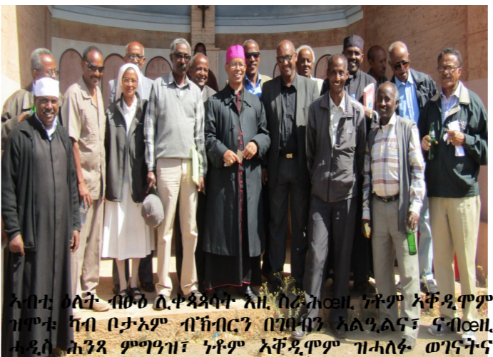
ኣብ ቤተ ክርስቲያን ብፁዕ ሊቀ ጳጳስና ኣቡነ መንግሥተአብ ተስፋማርያም ምስ ቆሞሳትን ምእመናንን ብምምኻር ንእኡ እትከታተል ኮሚቴ ብምቕም እቲ መስርሕ ዳግመ ሕንጻ ተጀሚሩ።