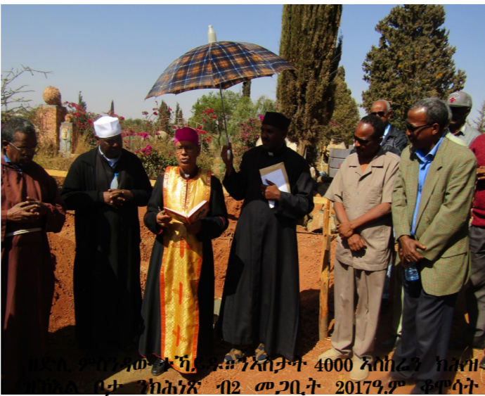
ኣብ ቤተ ክርስቲያን ብፁዕ ሊቀ ጳጳስና ኣቡነ መንግሥተአብ ተስፋማርያም ምስ ቆሞሳትን ምእመናንን ብምምኻር ንእኡ እትከታተል ኮሚቴ ብምቕም እቲ መስርሕ ዳግመ ሕንጻ ተጀሚሩ።

ንነዊሕ መዋዕል ክገልግል ዝጸንሐ መካነ መቓብር ጸጸራት ዘካቶሊካውያን ምእመናን እቲ ቦታ ስለዝመልኦ፣ ኣገም ንምፍታሕ ንሓድሎ ዓመታት ብቤተክርስቲያን ሓደ ሓደ ስጉምቲ ክውሰድ ከም ዝጸንሐ ዝፍለጥ ኮይኑ፣ ብፍላይ ካብ መጋቢት 2014 ዓ.ም ጀሚሩ ግን ብፁዕ ሊቀ ጳጳሳት ኣቡነ መንግሥተአብ ተስፋማርያም ምስ ቆሞሳትን ምእመናንን ብምምኻር ንእኡ እትከታተል ኮሚቴ ብምቕም እቲ መስርሕ ዳግመ ሕንጻ ተጀሚሩ።