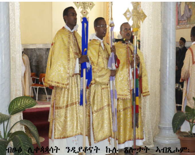
ብጹዕ ሊቀጳጳሳት ንዲያቆናት ኩሉ ጸሎታት ኣብጸሑም፡