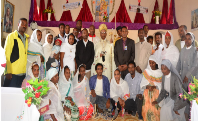
ስብከተወንጌልን ዘትኮረ መንፈሳውነት ከማዕብሉ ኣተባቢዮምዎም። ድሕሪ ቅዳሴ-ውን ኣብ ቁምስና እቲ መደብ ብጸብጸብ ማሕበርን ቃለ ማዕዳ ብፁዕ ሊቀጳጳስን ቃለ ምስጋናን ተዛዚሙ።

ኣብዚ ግዜና ሃይማኖት ካቶሊክ፡ ሃይማኖት ተዋህዶ ኣሪገን ኢየን እናበሉ ዘታሉሉ ብዙሓት ኢዮም-ውን፡ መንእሴታትና ኣብ ትሕቲና እንክለው ትምህርቲ ክርስቶስ ነጽግብም፡ ትምህርተ እምነቶም እንተጸገብም ደሓ ኣብ ዝኸድም ኣብ እምነቶም ይጸንዑ ኣይነቃንቁን ኢዮም። ነዚ ዝሕግዘም ከኣ ወለድን ቆሞሳትን መማህራን ትምህርተ ክርስቶስን ደናግልን ስለዝኾኑ፣ እዚኦም ኣብ መንእሴታት ዘለዎም ግደ ዓብይ ኢዩ ኢሎም። ነቶም ዓመታዊ መብጽዓኦም ዘሓደሱ ኣባላት ማሕበር ኣልዕሉ ኣልባቢኩሙ-ውን ትርጉም ስም ማሕበርም ዝያዳ ኣብ ጸሎት ዘድሃበ ስለዝኾነ ኣብ ጸሎትን