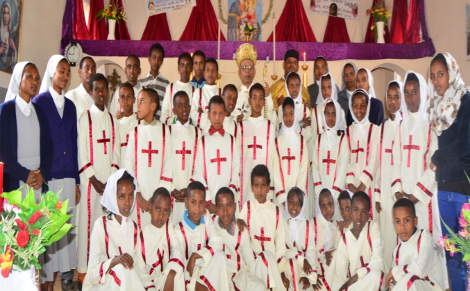
ስብከተም፡ እንቋዕ ገጽ ንገጽ ኣረኣኤየና ድሕሪ ምባል ካብ ወንጌል ዮሐንስ ብዛዕባ ስራሕ መንፈስ ቅዱስ ጠቁሶም፡ ንተቀባእቲ ሕቶታት ትምህርተ ክርስቶስ ኣቲቶም-ውን ብመልሶም ከኣ ኣዚዮም ተሓጉሶም። ምስጢረ ሜሮን፡

ተባዓት፡ ጽኑዓት፡ለባማት ክርስቲያን ዝገብረና ምስጢር ኢዩ። ኢየሱስ-ውን ኣብዚ ዓለም-ዓለም ብዙሕ ተቃውሞ ረኪቡ ኢዩ። ንሕና ግን ድኽማት ወደቅቲ ምዃና ኣይንረስዕ፡ ኩሉ ግዜ ኣገዝ ቅድስቲ ሥላሴ የድልየና።