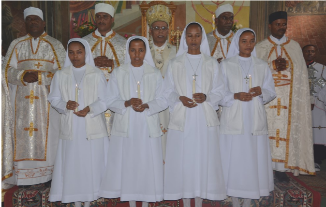
ድሕሪ ምባል፡ ንማሕበር እንቋዕ ሓገሰኻን ኢሎም።